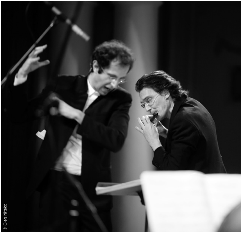
Drawing (2004) for eight players

This work was commissioned by the Internationales Musikinstitut Darmstadt in 2004 and composed for the ensemble recherche. It originates in one of my dreams: In the dream, I was a fetus asleep in my mother's womb. From the first happiness of being submerged in the amniotic fluid, I gradually felt a great pressure to be born, and in the end, I went through an intense process of what is called birth into this world. Then, born into this world, I entered once again the realm of happiness. I have tried to express the experience of this dream in music. Reminiscence for marimba was also a work in which I tried to express the resonances heard in the womb, and Drawing is a sketch with sound of the expulsion and release from the world of "reminiscence". I tend to look back at my own past, and as that tendency grows increasingly stronger, imagination seems to make its way to the source of my birth or the world before I was born.